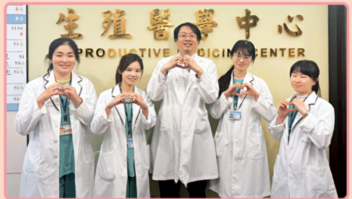
生殖醫學中心助好孕